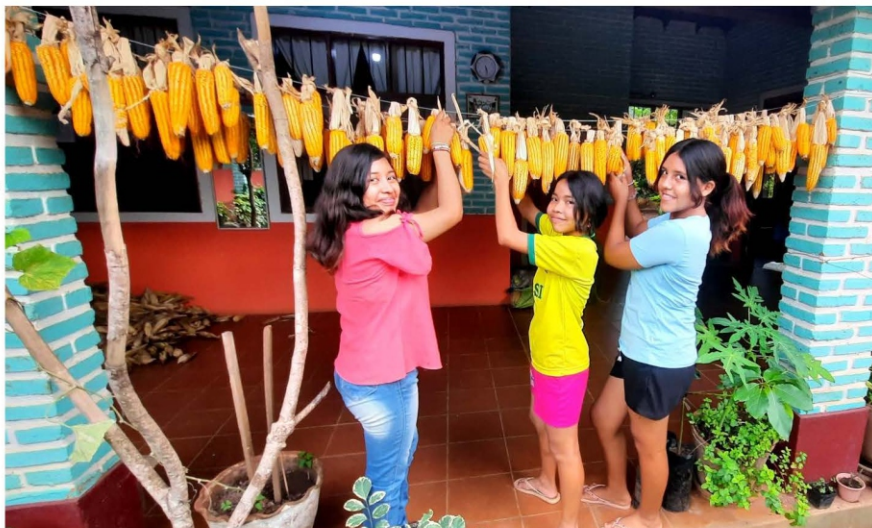
Die Maisernte der Jugendlichen war hervorragend – ein wichtiger Beitrag, um die Kosten für Lebensmittel zu senken.